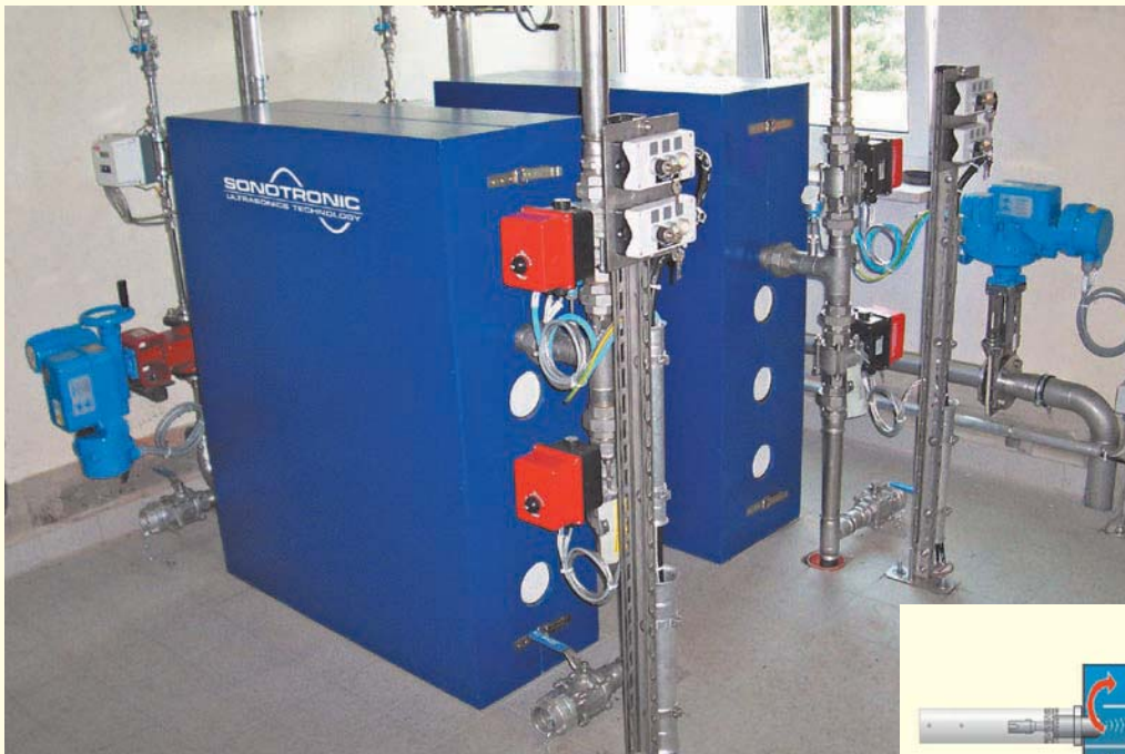
Anlage mit zwei installierten Ultraschallreaktoren

Mit einem innovativen Verfahren können beide Anwendungen optimiert werden. Die Verwendung von Ultraschall-Technik ermöglicht, die Wirtschaftlichkeit und das Ergebnis beider Anlagen deutlich zu verbessern. Durch die Behandlung der Klärschlämme mit Ultraschall wird die Restmenge reduziert, wobei gleichzeitig Biogas entsteht, das die Energieversorgung der Anlage abdeckt. In einer Biogasanlage bewirkt der Ultraschallreaktor eine Effizienzsteigerung, indem der Vergärungsprozess intensiviert wird und der Methangehalt im Biogas zunimmt. Dabei ist die Einbindung des Ultraschallreaktors in bestehende Anlagen durch die kompakte Bauweise sehr einfach durchführbar.