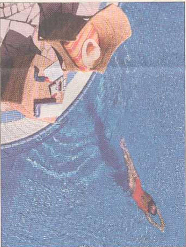
Keimfreies Vergnügen im Swimmingpool.

Auch das Abwasser behandeln die Harburger mit Ultraschall. Sie desinfizieren es beispielsweise. Das konkrete Forschungsprojekt: «An Nord- und