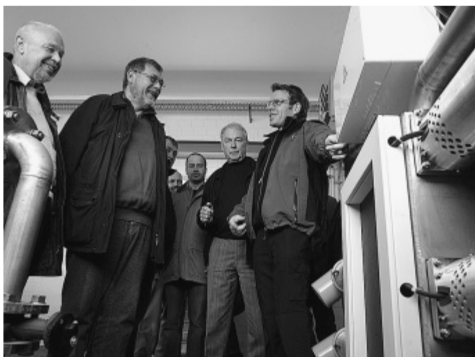
Faszinierte die Dänen: die „Blackbox“ (rechts) mit der Desintegrationsanlage, die den Stickstoffgehalt der Abwässer deutlich reduziert.

die Unterhaltungskosten für die Ultraschalldesintegration aus den Einsparungen decken. Die Dänen hörten den Bündlern ge-